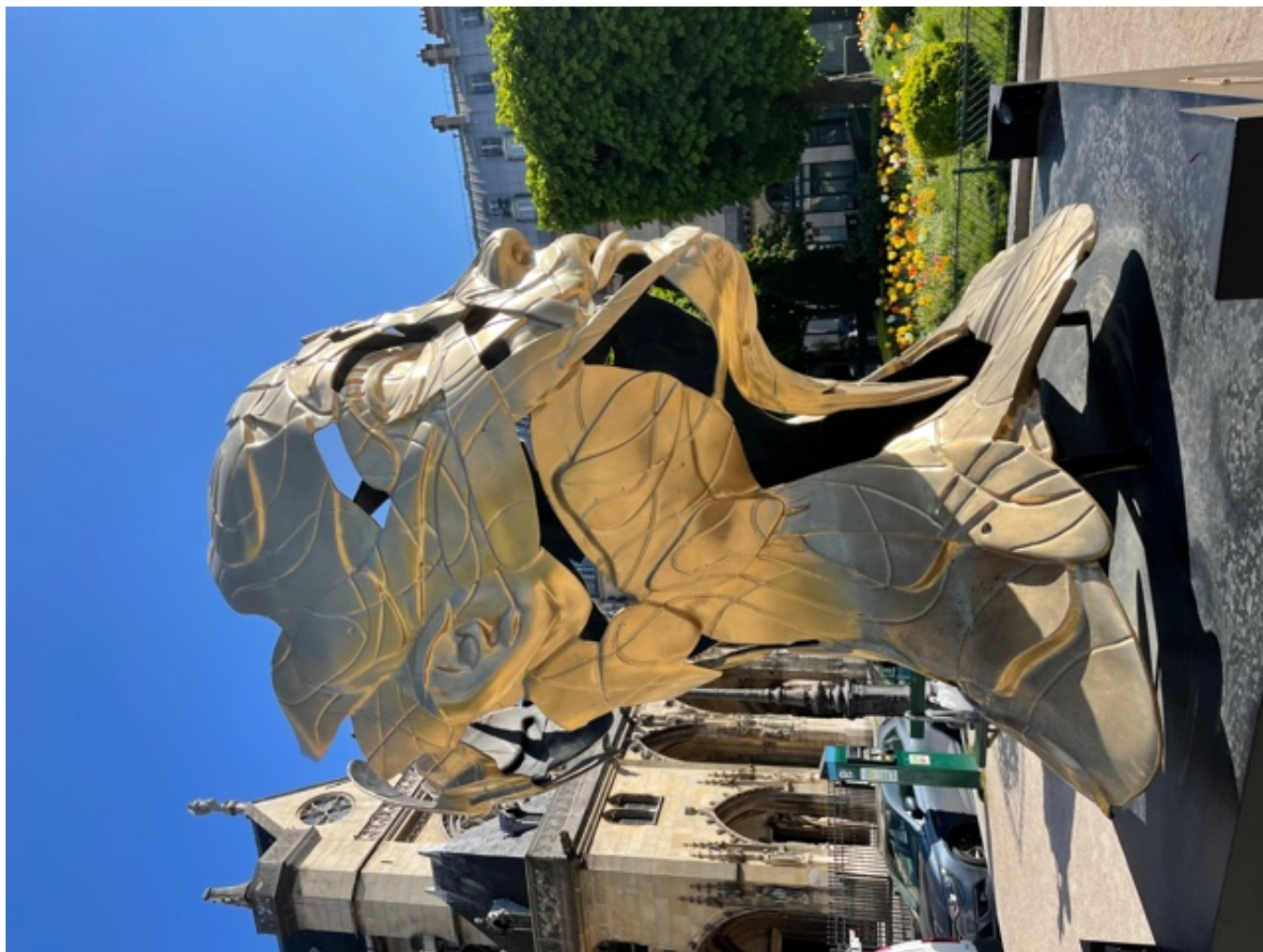
Des sculptures de visages d'Alexandre Monteiro "Hopare" à Paris